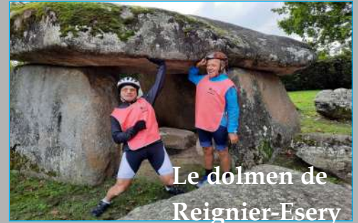
Le dolmen de Reignier-Esery